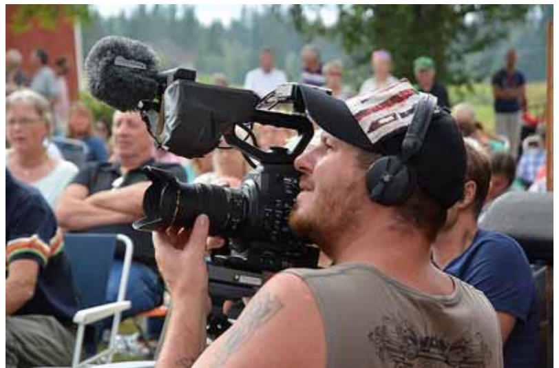
Stilstudier av en TV-fotograf ”in action”