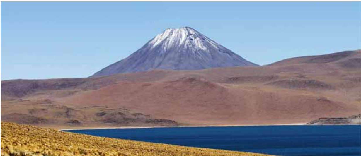
Laguna Miscanti med vulkanen Cerro Chilikues i bakgrunden.

Vi gjorde en dagsutflykt till en mycket högt belägen sjö som heter Laguna Miscanti. Den ligger på drygt 4.000 m.ö.h. och har inget utlopp. Området är numera en nationalpark och här fick vi inte röra oss fritt hur vi ville. Vi fick gå och åka längs den bilväg som leder hit och på den gångstig som syns längst till vänster på bilden. Den går från bilvägen ner till sjön. Vulkanen rakt fram är Cerro Miscanti med höjd av drygt 5.600 m.ö.h. I bakgrunden till vänster en annan vulkan, Cerro Chilikues, 5778 m.ö.h. Vi tog god tid på oss här på detta fantastiska ställe och vi stannade tills vi var nöjda. Den vita strandremsan är täckt av salt. Luften var härligt sval och det var absolut vindstilla. Här kan man tala om "hög" luft.