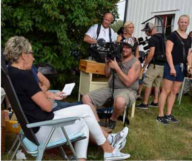
TV-fotograf i arbete

I början på augusti var vi på en auktion i Bratteggen. Där var också ett TV-team från SVT (tror jag). De spelade in ett avsnitt i en ny programserie som tydligen handlade om auktionsfynd i någon form. Två deltagare hade fått en summa pengar att handla för och sedan skulle inköpen utvärderas på något sätt. Här är några bilder från inspelningen under auktionen. Programmet kommer enligt uppgift att sändas under hösten .