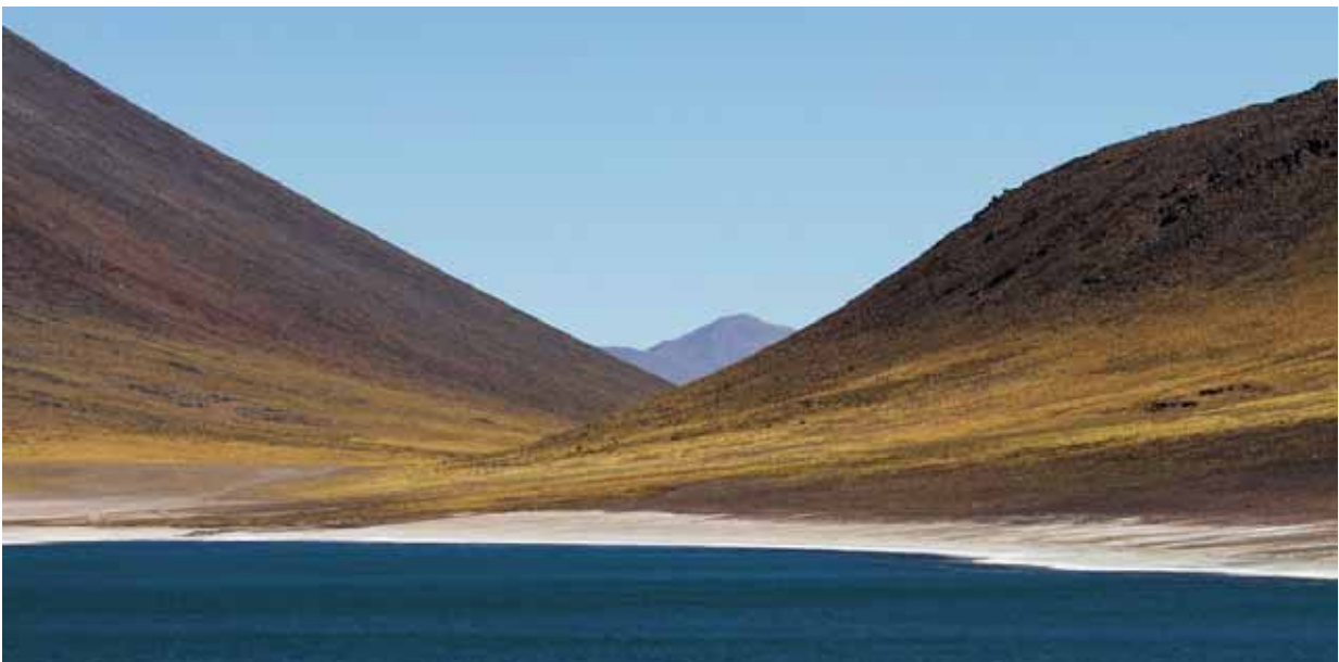
Laguna Miscanti i en annan riktning.