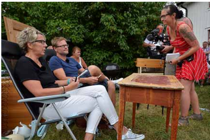
Deltagarna får instruktioner från en medlem av TV-teamet