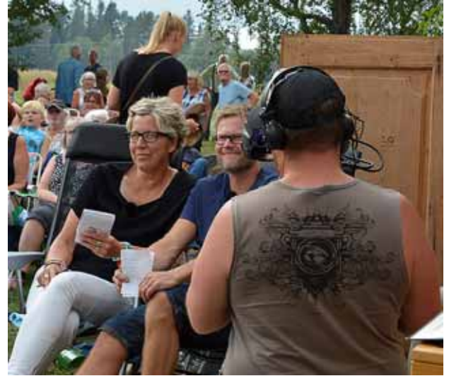
Det gällde för deltagarna att ignorera fotografen