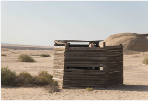
Såg aldrig något skräp. På några platser hade man satt upp en ”toalett”.