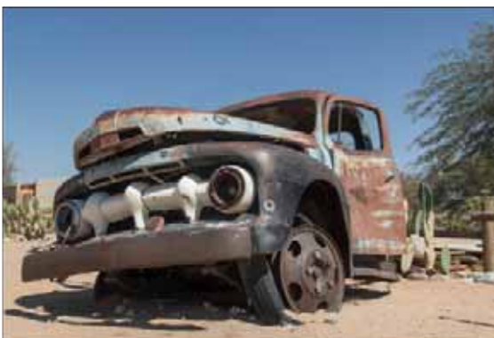
Text/foto: Kerstin Andersson