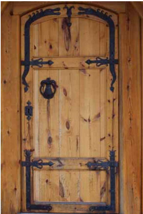
Här har jag försökt visa det vackra smidet på entrédörren. Smidet berättar en historia med kopplingar till både asatro och kristendom.