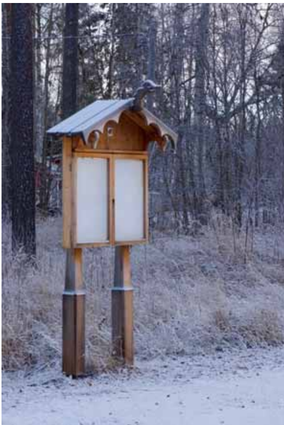
Bara anslagstavlan är ett mästerverk i sig.

Jag kan inte låta bli att imponeras av dessa eldsjälar i Lillsjöhögen som fick en idé om att bygga en Stavkyrka. Det stannade inte bara vid en idé, utan den förverkligades också och efter 4 år stod den klar för invigning.