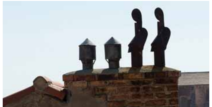
Smala gränder i Gamla Staden

Under kriget 1991 besköts Dubrovnik med artilleri. Under uppbyggnaden efteråt behövde man ju bl. a takpannor med rätt patina. För att lösa det reste man runt i byarna och erbjöd ägarna till gamla hus två nya takpannor mot en gammal. Det räckte inte hela vägen så på en del ställen fick man lägga nya pannor undertill och gamla ovanpå.