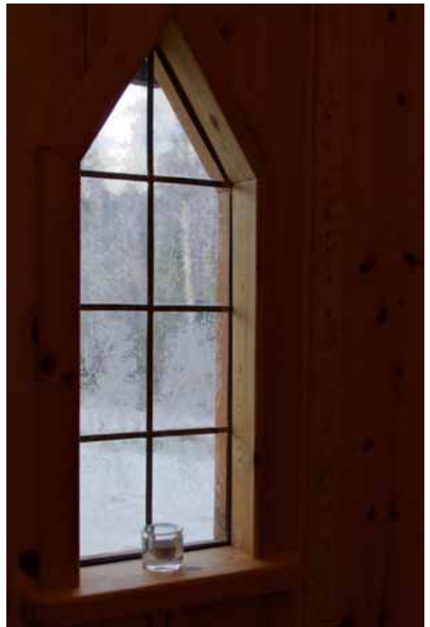
Ett blyinfattat fönster som dekorerats vackert av iskristaller.