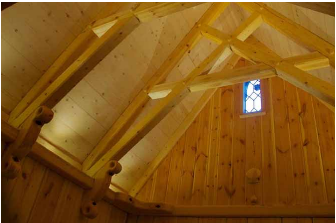
En interiörbild som visar takkonstruktion och även ett blyinfattat fönster i korets vägg.