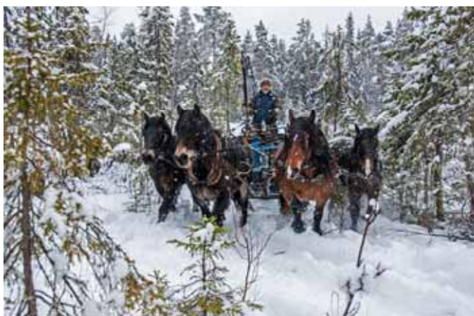
Vedkörning med mödrar och söner