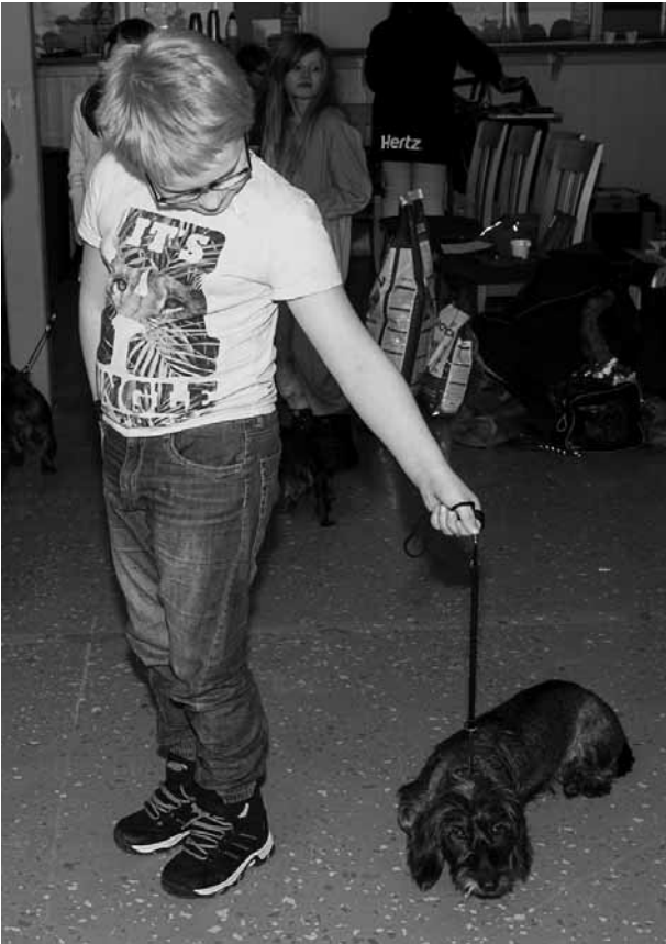
Jag vill inte!!

Bilder från en taxutställning på Travet. Sonhustrun och barnbarnet var där med familjen tax Yra. Ett moment var "Barn med hund" då barnen skulle få pröva på att gå i utställningsringen. Det tyckte alla var en rolig idé, alla utom Yra. Hon ville inte alls gå och visa upp sig tillsammans med lillhuse Hugo.