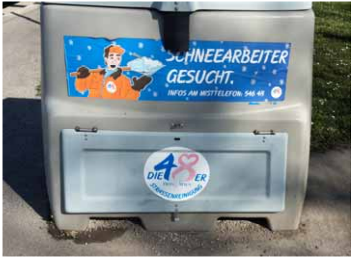
Om ni saknar snön hemma finns det ställen där ni behövs