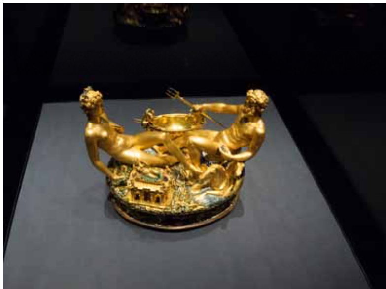
Cellinis beömda saltkar i guld var ett måste att se. Praktfullt!