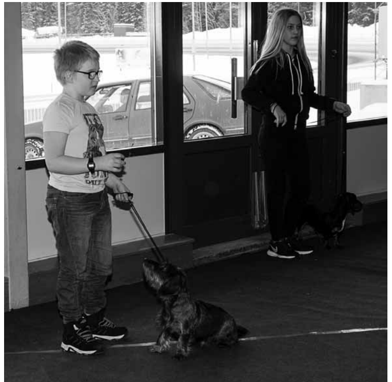
Men lillhuse förstår du inte att jag inte vill!