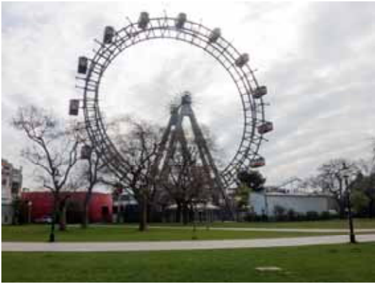
Pratern, jämförbart med Gröna Lund i Sthlm. Pariserhjulet

Min lillasyster och jag tillbringade en vecka i Wien med allt vad som tillhör: Stora slott, praktgemak, otaliga marmorstatyer, målningar en masse, många gröna parker och museér i mängd. Det är svårt att föreställa sig hur de mäktiga kunde leva på detta vis. I alla fall, här är några andra intryck från denna hektiska stad.