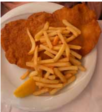
Matspecialiteter, syrran åt schnitzel...