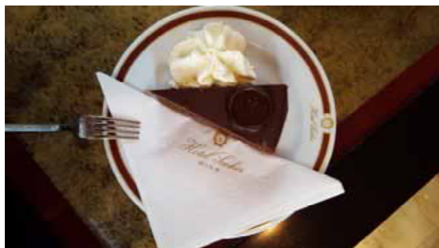
....medan jag frossade i Sacher-torte.