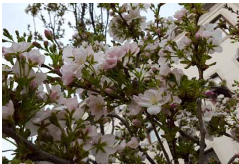
Trodde jag hade hittat körsbär, men det är nog snarare plommon eller äpplen?