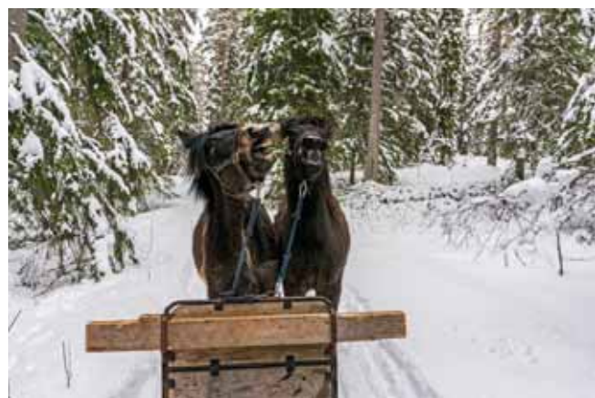
Det sker Mobbing även i djurvärlden