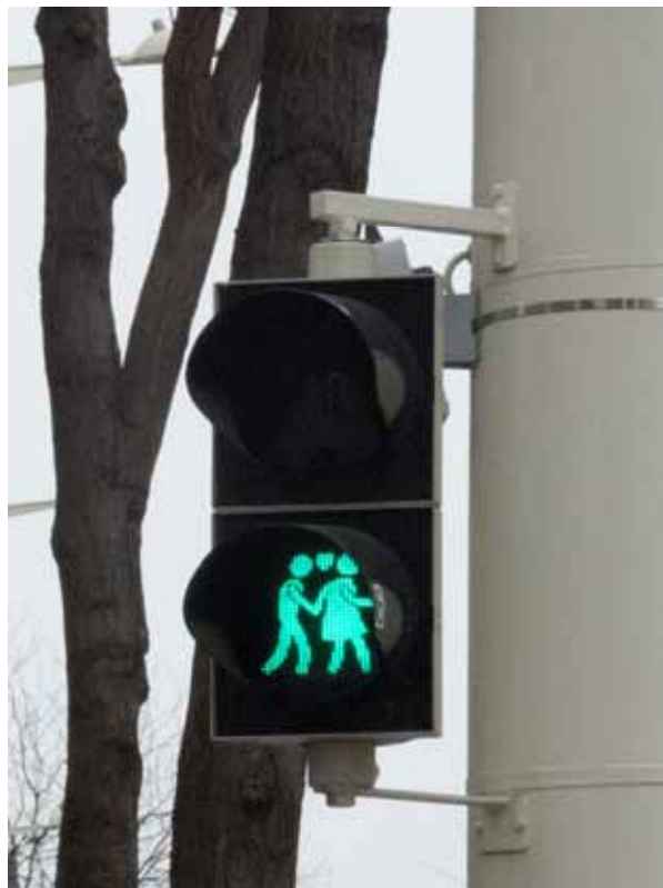
Deras Herrgårman är väl för gulliga. Märk väl att kvinnan leder!