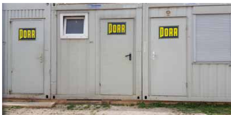
Vad man har för sig här förtäljer icke historien. Men gissa får man!