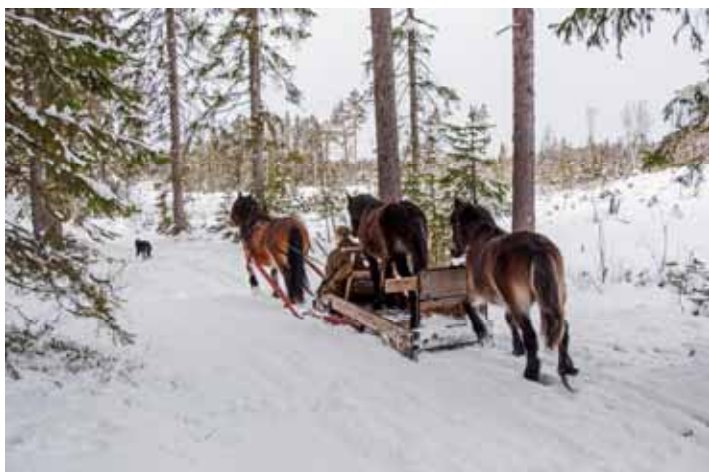
Även ungdomar i djurvärlden kan vara lata.