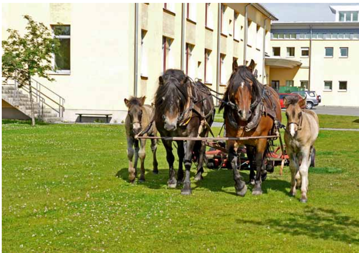
Gräsklippning på campus med mödrar och söner