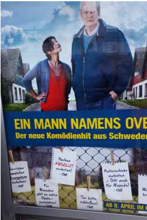
Ove var på gång. Undrar hur han låter på tyska!