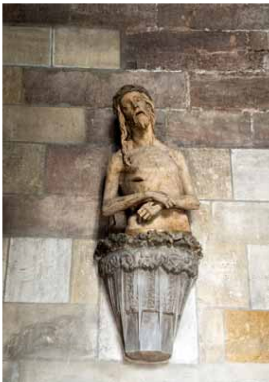
I Stefansdomen finns en väggskulptur som kallas "Jesus med tandvärk" Hm.