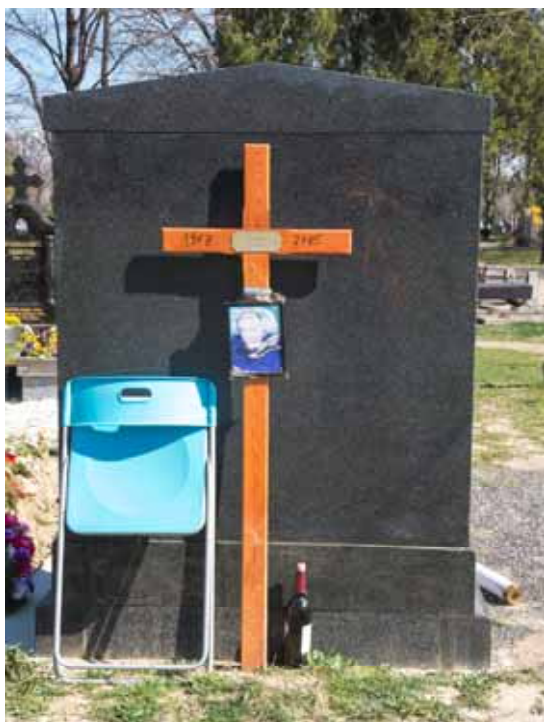
Det här är ett sympatiskt sätt att komma ihåg de döda. Sätt dig på stolen, ta en slurk vin och minns!