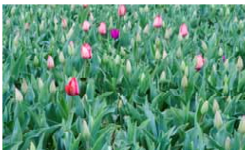
Tulpaner på gång