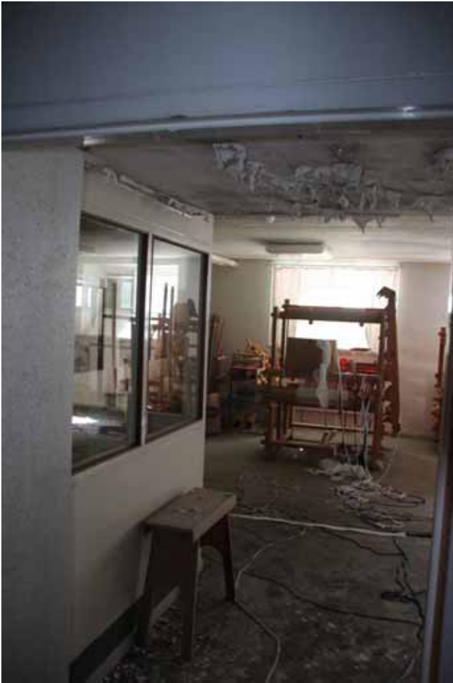
Vävstolarna stod kvar