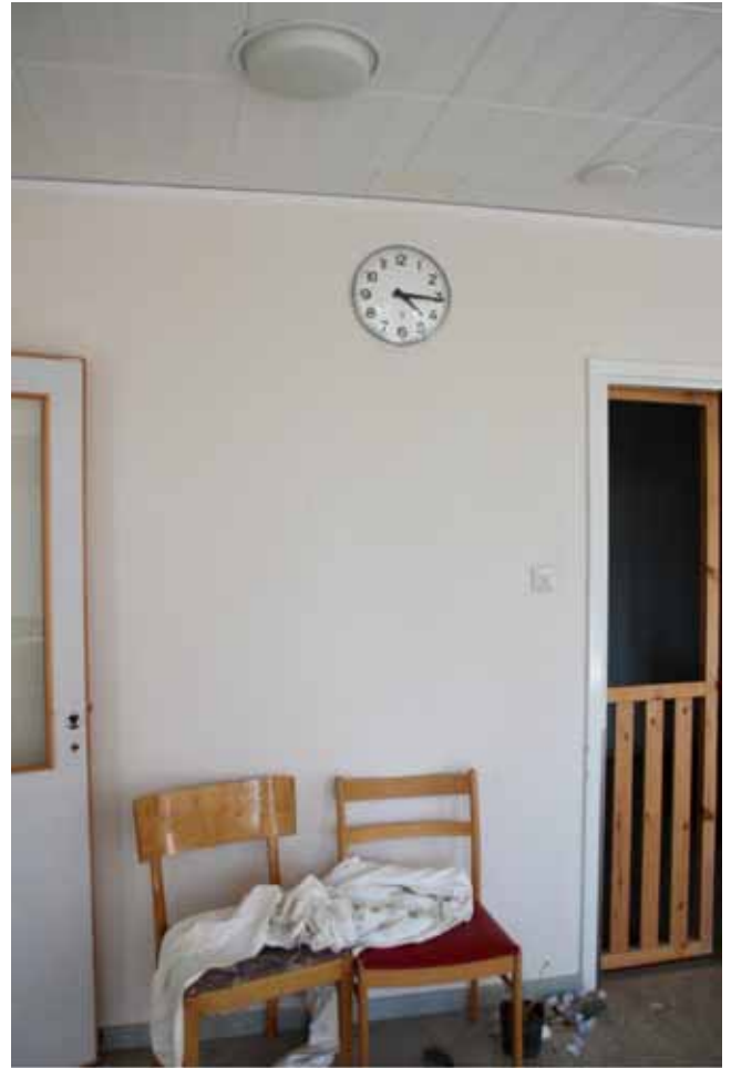
Väntan är över