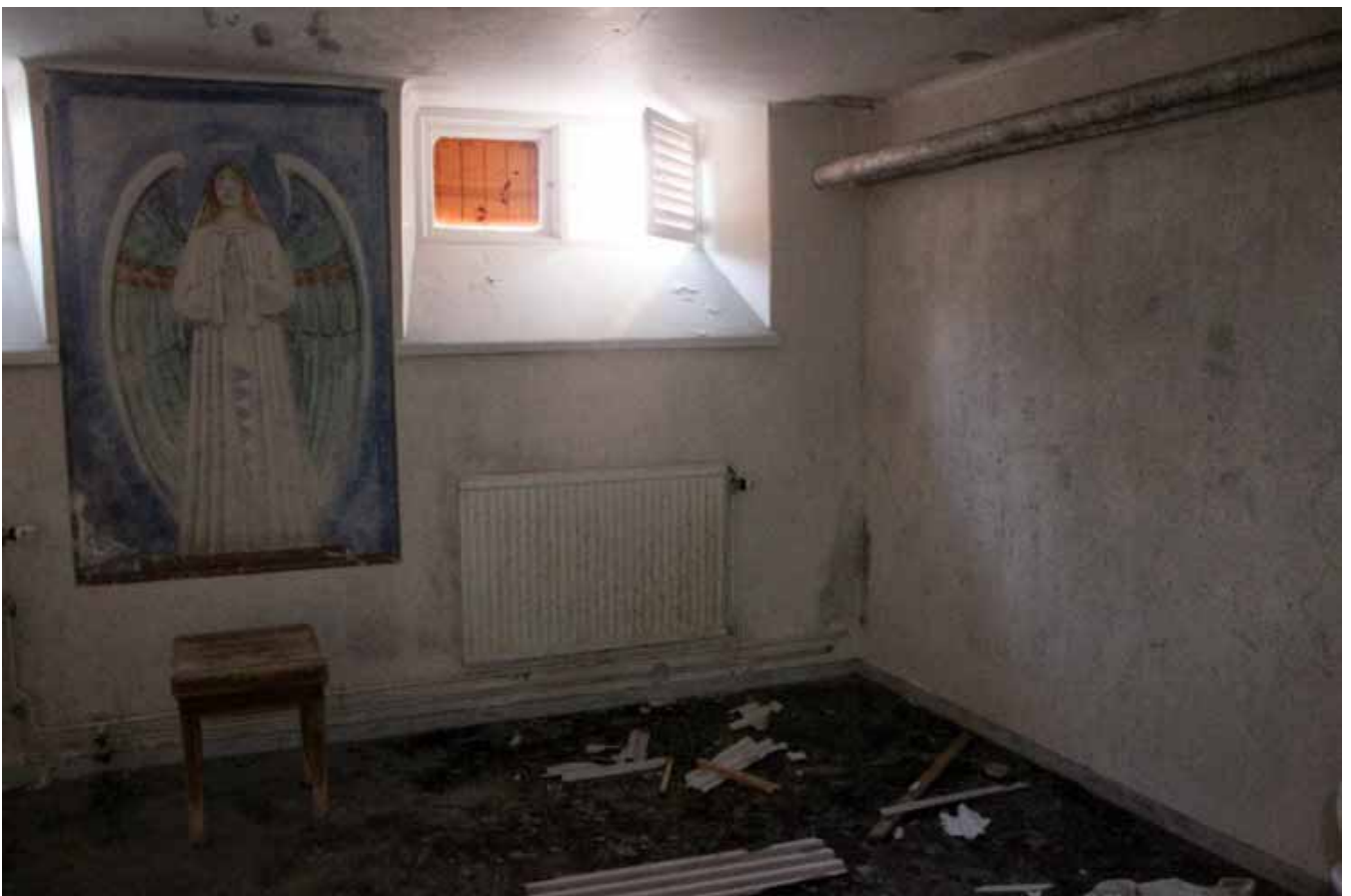
Här är rummet där de döende och även döda förvarades i