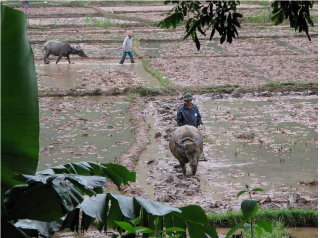
Husen ligger nära odlingarna och är helt byggda av lokala växter. Några få har plåt på taken. Rök stiger upp ur taknocken, men inga skorstenar syns till. Höns, ankor och grisar strövar kring gårdarna. Idyllen är bedövande vacker, grön och stilla.