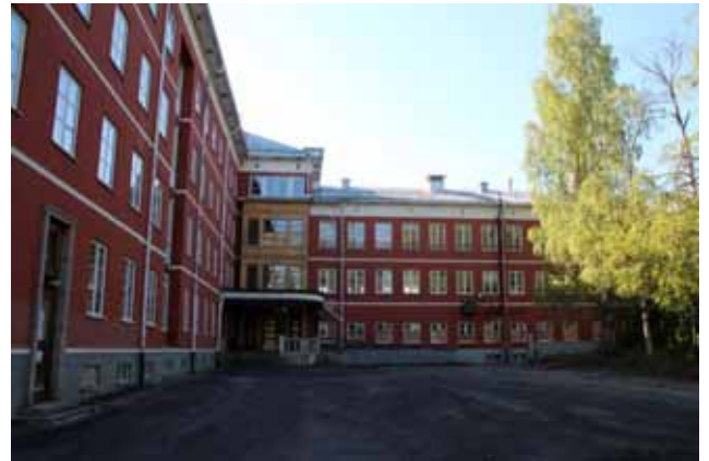
Lika stort i fil åt andra hållet