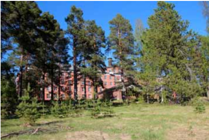
Sanatoriet i Sandträsk.

Här är ett axplock ur min "Sandträsk sanatorium" mapp.