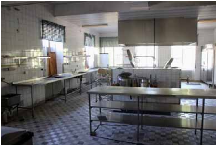
I köket fanns allting kvar