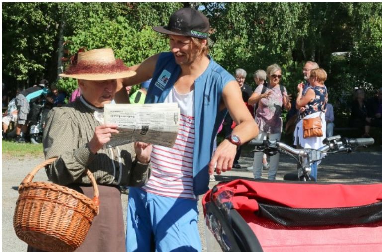
Text och bild: Kerstin Andersson